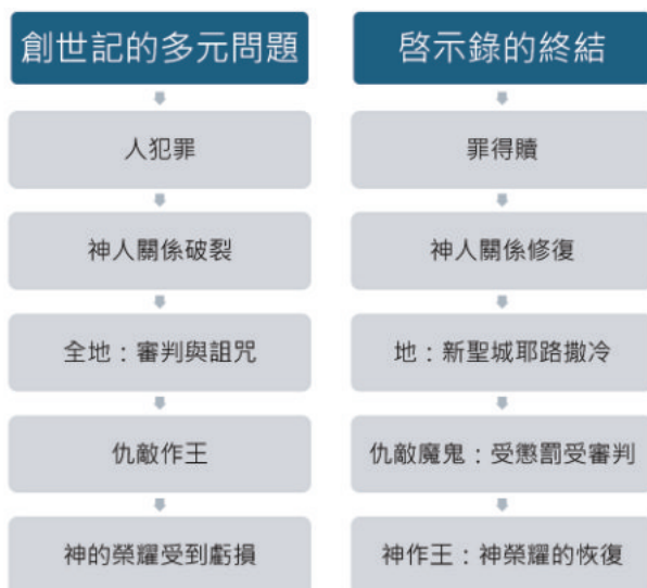
圖表1 神的心腸：創世記的問題和啟示錄的答案

雖然暫時放下我們熟悉的大使命，但當我們以這個三個問題思考聖經時，就會發現三一神是關係的神：第一，三一神相互相屬；第二，三一神介入受造世界；第三，三一神與人親近、立約、施行審判、道成肉身，並捨身救贖等等。宣教是神主動的作為，不僅如此，神也差遣祂的子民百姓仿效祂的形態，主動進入不同的群體中，活出信仰，建立關係，藉教會和受差者與地上的萬族重新建立親密的關係。