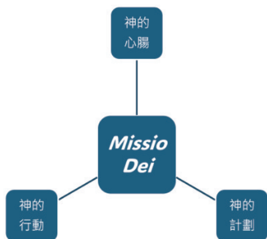
圖表 3 用來探討 Missio Dei 的三個主題